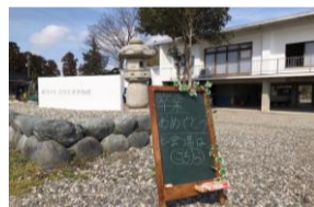
西部スポーツクラブスイミングクラブ(6年生)送別会

オープン後、いろんな団体、個人に活用頂いています / リモートワーク、個人学習、仲間とお茶、趣味の集い等に! 新年度は、”音楽コンサート”、”農産物直売場”、会議会場等の予約が入っています