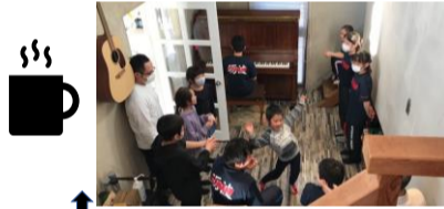
近所の若い方たちが集まりました(小・中・大学生&社会人)